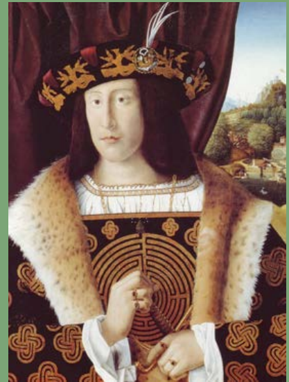
Fitzwilliam Museum, cambridge, inv. 133 Bartholomeo Veneto, Portrait d'un gentilhomme avec un labyrinthe (1510-1515). Ce tableau de la Renaissance, contemporain du château de Boutemont (1538), montre un personnage tenant un labyrinthe contre son cœur : symbole d'une quête intérieure vers la connaissance.

Le Jardin du Labyrinthe intègre également une dimension pédagogique. Le tracé comporte 16 lettres discrètement gravées. En les repérant une à une, les enfants peuvent reconstituer le nom de la grande structure d'étoiles en spirale visible au-dessus du domaine en septembre. Un jeu d'observation qui prolonge la découverte tout en sensibilisant au patrimoine céleste.