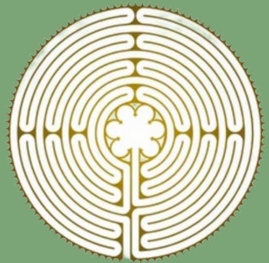
Labyrinthe de Chartres